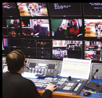
Controller per videowall