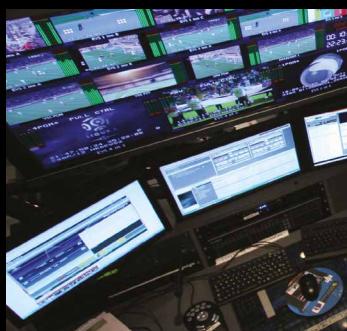
Estensione e commutazione a matrice KVM