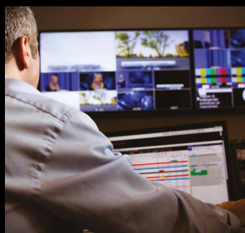
Esperienza utente semplificata