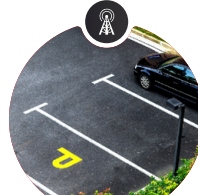
Capteur d'occupation des places de parking

Cette solution tout-en-un vous offre le contrôle intégral de votre salle grâce à une interface Web intuitive