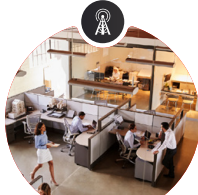
Sonde de température /bien-être