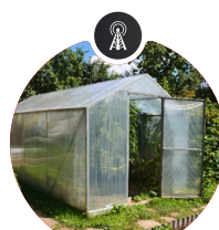
pH du sol et sonde d'humidité

Réseau local Contrôle du matériel par SNMP / PING / WGET, etc.