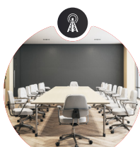
Qualité de l'air/décompte de personnes