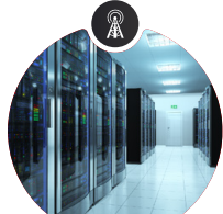
Détecteur de fumée/humidité dans les centres de données