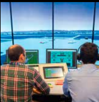
Operaciones de la sala de control