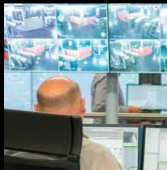
Control de seguridad