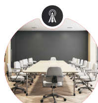
Sensor de calidad del aire / conteo de personas