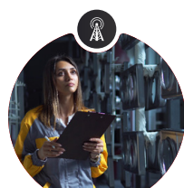
Diferentes sensores para control de calidad