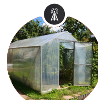
Sensor de pH y humedad del suelo