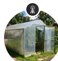
Sensor de pH y humedad del suelo