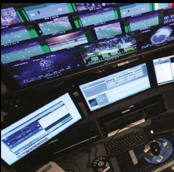
KVM-Matrixswitching und -verlängerung