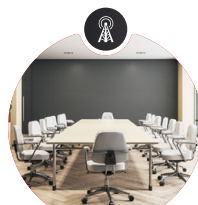
Sensor für Luftqualität/ Personenzählung