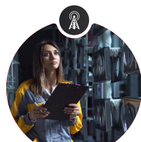
Verschiedene Sensoren für die Qualitätskontrolle