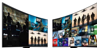
Diagrama conceptual del espacio de trabajo Emerald® DESKVUE

El funcionamiento silencioso y el tamaño extremadamente pequeño, combinados con varias opciones de montaje, garantizan un espacio de trabajo limpio y bien organizado.